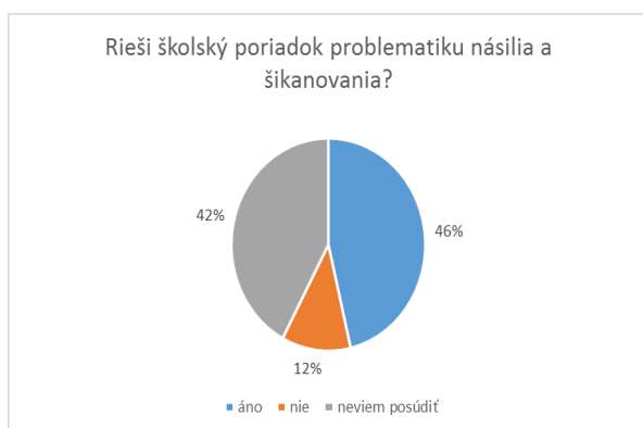
Graf č. 6

Kontrolované SOŠ deklarovali, že so školským poriadkom boli žiaci oboznámení prevažne na začiatku školského roka počas úvodných triednických hodín, čo žiaci potvrdili svojím podpisom do zápisnice. Paradoxom voči tomuto zisteniu boli výsledky dotazníkového zisťovania, v ktorom z 556 žiackych respondentov až 42 % nevedelo posúdiť, či školský poriadok rieši problematiku násillia a šikanovania (Graf č. 6). Podobne ako v prípade G možno opäť konštatovať, že aj zo strany SOŠ sa jednalo len o formálne a nekomplexné oboznamovanie žiakov so školským poriadkom.