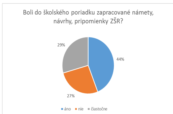
Graf č. 7

Dotazník pre žiacku školskú radu (ďalej ŽŠR) vyplnilo spolu 75 respondentov. Vyše polovica z nich (63 %) sa vyjadrila, že prostredníctvom ŽŠR žiaci navrhujú aktivity do plánu práce školy. S týmto vyjadrením nesúhlasili 3 % respondentov a podľa 35 % sa návrhy a podnety zo strany žiakov na zlepšenie práce školy vyskytli len niekedy. Podľa 27 % opýtaných neboli do školského poriadku zapracované ich návrhy, námety či pripomienky. Naopak, zapracovanie návrhov potvrdilo v dotazníku len 44 % a čiastočné zapracovanie deklarovalo 29 % respondentov (Graf č.7). Podobne ako na G, aj v SOŠ bolo možné konštatovať, že participácia žiakov na tvorbe a revízií školských poriadkov sa nejavila ako dostatočne efektívna.